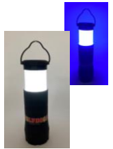
LEDミニランタン プレゼント (保護者の方)

2017年から続く「稲沢イルミネーション」は、青色LEDが開発・生産された街として冬の稲沢に光を通じて賑わいのある街にしたいという想いから続くイベントです。今回はこの稲沢イルミネーション点灯式にウルドくんが参加しますので、皆さんもオリジナルペットボトルをつくって一緒に点灯式に参加しませんか。