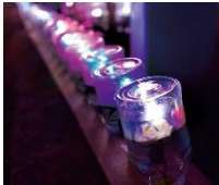
LEDペットボトル® プレゼント (お子様)

11月5日(土)のホームゲーム『ウルドタウン稲沢DAY』のイベントの一つとして、LEDのまち稲沢をウルドくんと一緒に楽しむツアーを企画しました！